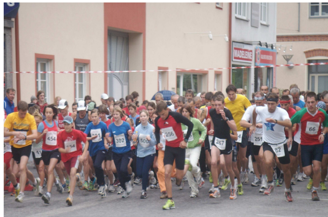
Foto: 8.Int. Ebreichsdorfer Stadtlauf 27.09.2009